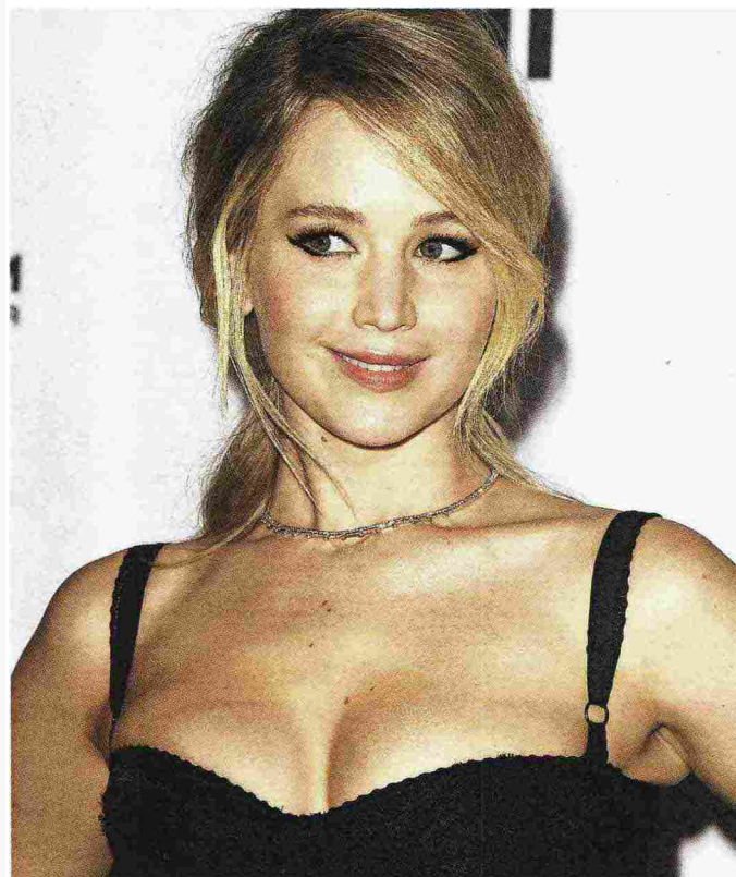
STATUARIA Giovane e sicura di sé, l'attrice Jennifer Lawrence ama indossare abiti con tagli che valorizzino il suo décolleté

Volumizzante seno di Pupa Milano contiene un'elevata concentrazione di Volufiline, bio-estratto purificato da gardenia asiatica, che favorisce l'aumento di volume delle cellule adipose (100 ml, 33 euro)