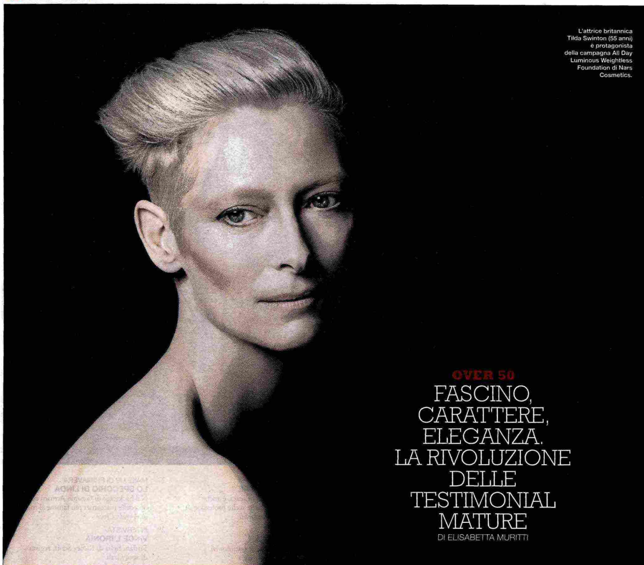
L'attrice britannica Tilda Swinton (55 anni) è protagonista della campagna All Day Luminous Weightless Foundation di Nars Cosmetics.

OVER 50 FASCINO, CARATTERE, ELEGANZA. LA RIVOLUZIONE DELLE TESTIMONIAL MATURE