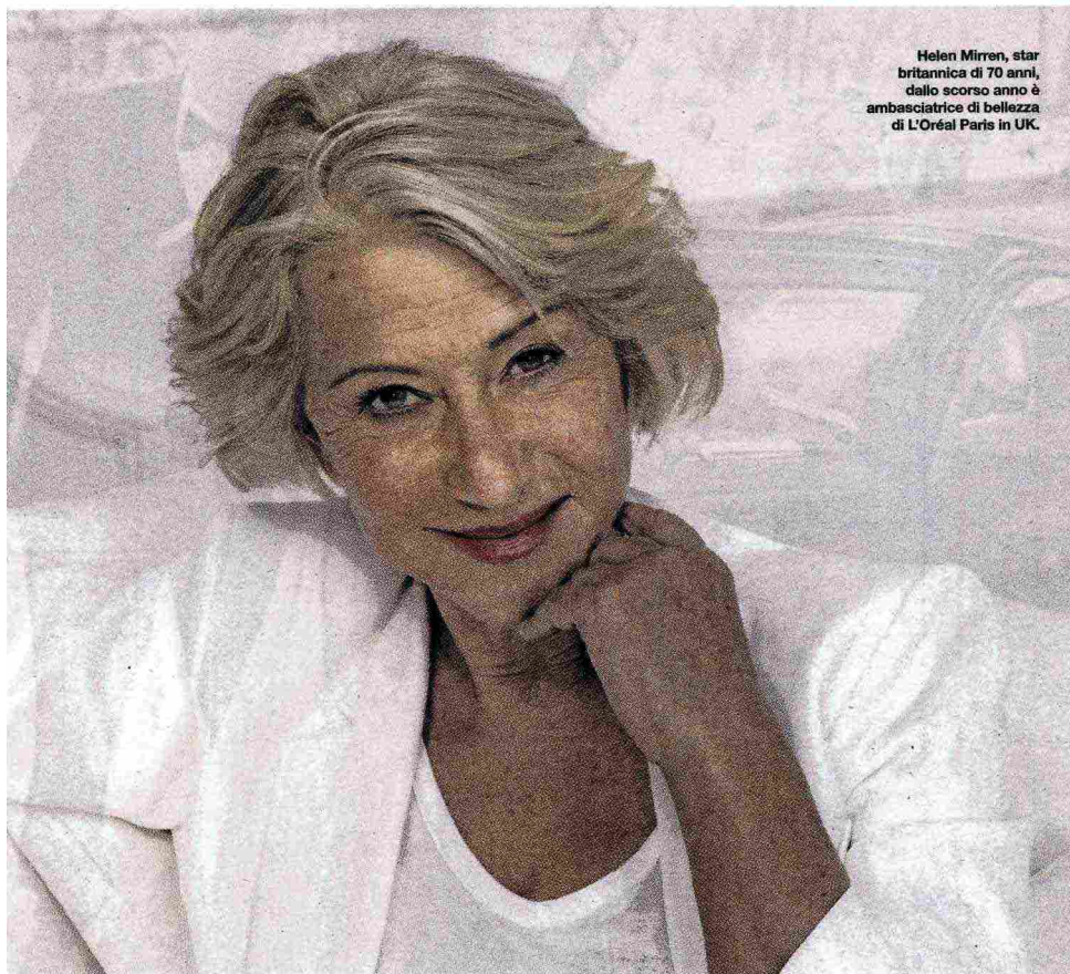
Helen Mirren, star britannica di 70 anni, dallo scorso anno è ambasciatrice di bellezza di L'Oréal Paris in UK.

YOGA IN CREMA Quanto tempo trascorri davanti a smartphone, iPad, PC? La prima causa di affaticamento oculare è la lettura su schermo, che provoca secchezza oculare e peggiora rughe, borse, occhiaie. In soccorso arriva Ultimune Eye Power Infusing Concentrate di Shiseido (15 ml, 65 euro), con un complesso botanico a base di ginkgo biloba antiossidante, estratto di timo e perilla antinfiammatori, che preservano l'attività delle cellule di Langerhans, rinforzando le difese della pelle, eotina e xilitolo per l'idratazione.