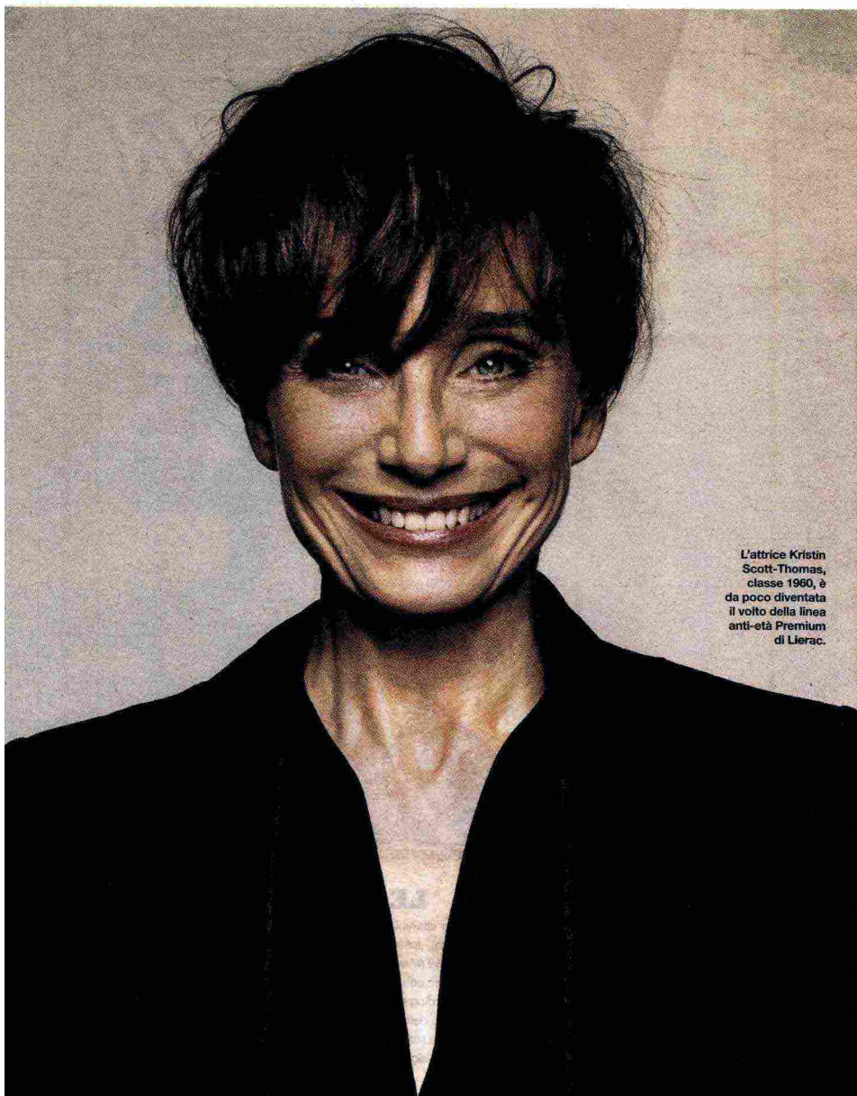
L'attrice Kristin Scott-Thomas, classe 1960, è da poco diventata il volto della linea anti-età Premium di Lierac.