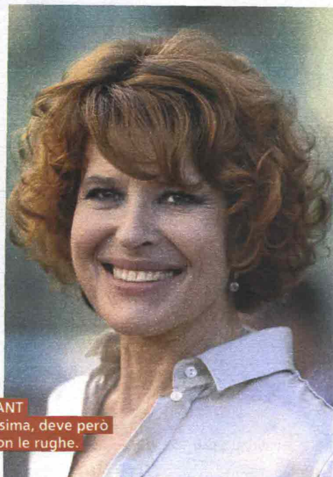
FANNY ARDANT Sempre bellissima, deve però fare i conti con le rughe.