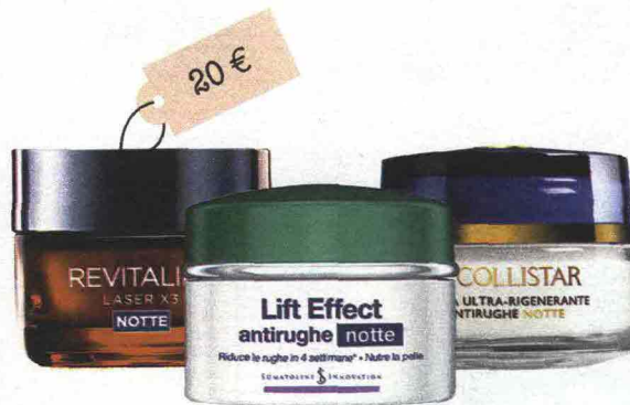
Revitalift Laser X3 Notte (L'Oréal Paris, 20 euro): favorisce la formazione di collagene. Lift Effect Antirughe Notte (Somatoline Cosmetic, 33 euro): stimola il micro circolo e il rinnovamento cellulare. Crema Ultra-Rigenerante Antirughe Notte (Collistar, 53 euro): rinforza la pelle e i capillari.

L'idea in più La sera stendi una maschera di yogurt e miele per 15 minuti.