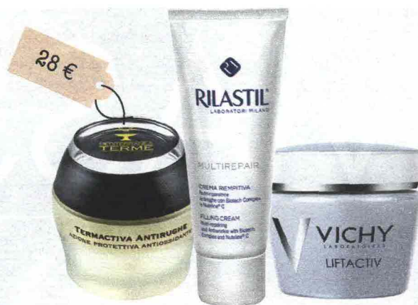
Termactiva Antirughe (Mediterranea, 28 euro): con vitamina E e filtri solari. Crema Riempitiva (Rilastil, 59,50 euro): contiene principi attivi antirughe e SPF 6. Liftactiv (Vichy, 33,50 euro): stimola il rinnovamento cutaneo e ha un effetto lifting.

L'idea in più Prima della crema vaporizza sul viso dell'acqua termale.