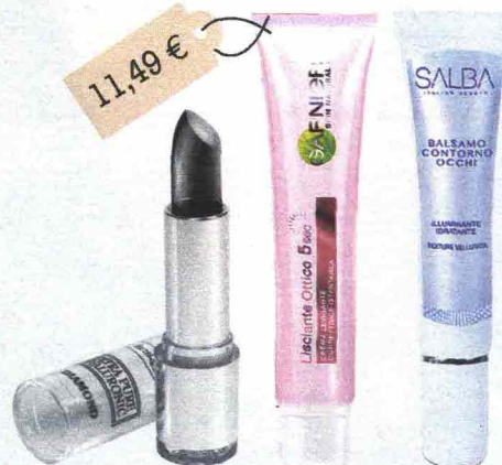
Extra Pure Hyaluronic Black Diamond (Incarose, 17,50 euro): con acido ialuronico e polvere di perla. Lisciante Ottico (Garnier, 11,49 euro): contiene riflettori della luce. Balsamo Contorno Occhi (Salba, 11,99 euro): con acido ialuronico, burro di karité e micropolveri di perla.

L'idea in più Picchietta contorno occhi e labbra: aiuta a distendere le rughe.