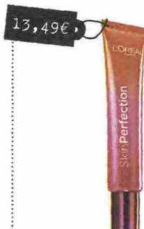
Skinperfection (L'Oréal Paris, 13,49 euro): con microperle cromatiche ed estratti vegetali rigenera il viso e lo accende di nuovo colore.