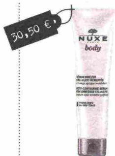
Sérum Minceur Cellulite Incrustée (Nuxe, 30,50 euro): con con caffeina ed estratto di foglie di papavero scioglie i grassi e rassoda.