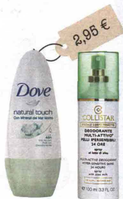
Natural Touch 48 h (Dove, 2,95 euro): con minerali del Mar Morto, dall'azione protettiva. Deodorante Multi-Attivo Pelli Ipersensibili 24 Ore (Collistar, 15 euro): con latte di aloe.

L'idea in più Dopo aver messo il deodorante, tampona le ascelle, così togli ogni traccia di umidità.