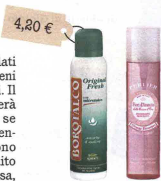
Original Fresh Deodorante Spray (Borotalco, 4,20 euro): dal profumo super classico. Deo Profumato (Le Fragranze di Perlier, 6,24 euro): dai frizzanti sentori dei fiori d'arancio.

L'idea in più Dopo aver messo il deodorante, lascialo asciugare: la fragranza si fissa sulla pelle.