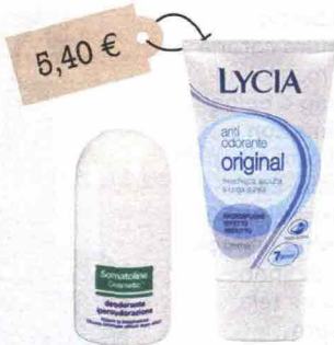
Deodorante Ipersudorazione (Somatoline Cosmetic, 11 euro): con sali di alluminio, assorbenti. Original Anti Odorante (Lycia, 5,40 euro): con microspugne a effetto asciutto.

L'idea in più Se sudi troppo, evita cibi tipo aglio e cipolla: favoriscono i cattivi odori.