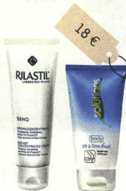
Seno Crema Concentrata (Rilastil, 34 euro): con oli vegetali e mentil lattato. Firm Bust Gel Rassodante Seno (Avon, 18 euro): con estratto di melograno, modella e tonifica.

proprietà nutrienti (burro di karité e oli vegetali), che mantengono l'epidermide elastica; liftanti (mentil lattato), che contrastano il rilassamento cutaneo; rimodellanti (estratto di melograno), che agiscono come una sorta di guaina. Questi cosmetici vanno stesi quotidianamente, con movimenti a otto. L'idea in più Quindici flessioni sulle braccia due volte al giorno rinforzano i muscoli pettorali.