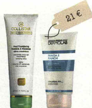
Trattamento pancia e fianchi (Collistar, 37 euro): con guaranà e alghe marine. Pancia e Fianchi (Dermolab, 21 euro): contiene un complesso che stimola il metabolismo.

esempio il guaranà, le alghe marine e i complessi formulati apposta per stimolare il metabolismo, vanno applicati tutti i giorni, con massaggi specifici che prevedono piccoli movimenti circolari orari e antiorari, da eseguire con i pugni chiusi fino a che la pelle ha completamente assorbito il trattamento. L'idea in più Due serie da 20 addominali al risveglio e prima di dormire appiattiscono la pancia.