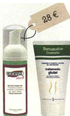
Mousse Lato B (Iodase, 28 euro): con effetto caldo-freddo, stimola la circolazione. Trattamento Glutei (Somatoline Cosmetic, 36 euro): sollecita il microcircolo e tonifica.

trattamenti in grado di favorire la microcircolazione con un effetto caldo-freddo, oppure grazie a complessi di principi attivi messi a punto proprio per questo obiettivo. I prodotti devono essere applicati due volte al giorno, per un effetto urto, e poi una sola, con massaggi a "impasto" piuttosto energici. L'idea in più Dieci affondi alla mattina e alla sera sollevano i glutei e li scolpiscono.