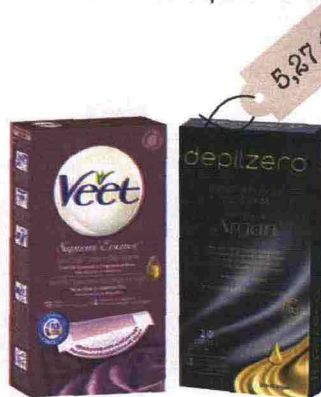
EasyStrip (Veet, 6,59 euro): facili da usare anche per chi è alle prime armi. Strisce Depilatorie Viso e Bikini (Depilzero, 5,27 euro): con olio d'Argan, dermoprotettivo.

L'idea in più Dopo lo strappo applica una crema che aiuti la pelle a ripristinare il film idrolipidico.