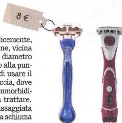
Venus Oceana (Gillette, 8 euro tre pezzi): con testina oscillante. Quattro for Woman Bikini (Wilkinson, 12 euro): con quattro lame ultrasottili.

L'idea in più Dopo la depilazione non applicare deodoranti con alcol: possono dare bruciore.