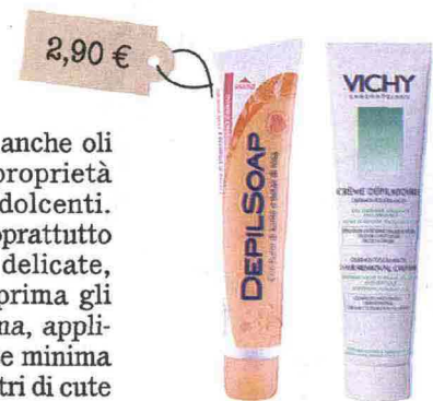
Crema Depilatoria Corpo (DepilSoap, 2,90 euro): formulata apposta per viso e zona bikini. Crema Depilatoria Dermo-Tolerance (Vichy, 13 euro): con olio di mandorle e acqua termale.

L'idea in più Dopo la depilazione elimina i residui di crema con cotone imbibito di olio di mandorle dolci.