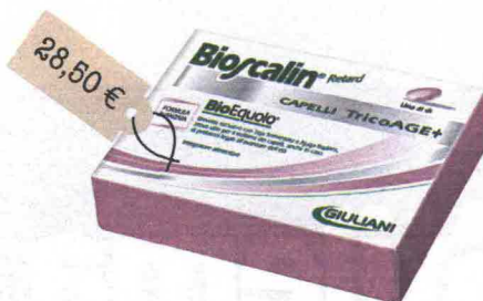
TricoAge+ (Bioscalin, 28,50 euro): sono consigliati 2-3 cicli all'anno.

✳ Il punto di forza: a lento rilascio nutre la chioma 24 ore.