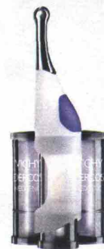
Dercos Neogenic (Vichy, 61 euro): una fiala alla mattina e alla sera.

✳ Il punto di forza: è dotato di applicatore massaggiante.