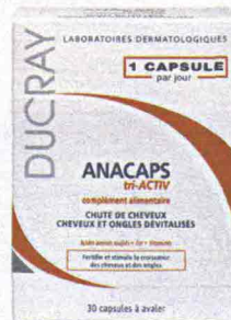
Anacaps tri-Activ (Ducray, 30 euro): i risultati si notano dopo 3 mesi.

✳ Il punto di forza: rinforza sia i capelli sia le unghie.