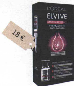
Arginina Resist (Elvive, L'Oréal, 18 euro): una fiala al dì per un mese.

✳ Il punto di forza: nutre il capello dalla punta al bulbo.