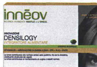
Densilogy (Inneov, 32 euro): va preso durante uno dei pasti principali.

✳ Il punto di forza: rende la chioma anche più voluminosa.