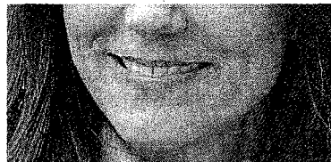
Naturali Kate Middleton, 30 anni