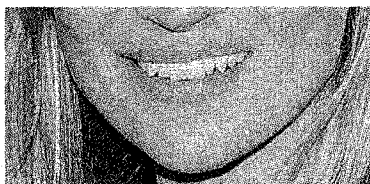
Sottile Kate Moss, 38 anni lunedì