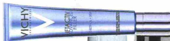
Con retinolo puro Liftactiv Advanced Filler di Vichy (39,50 euro, in farmacia).

Racchiudono un ingrediente top in alte percentuali e assicurano risultati mirati