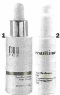
1. Con collagene il siero Dibi Face Fill Perfection (68,50 euro, in istituto) ha un'azione riempitiva. 2. Ultra-firming Serum DNA di Resultime (55 euro) distende le rughe sulla fronte.

E se non dovesse bastare? C'è una nuova tecnica chiamata D.A.T. (Dual Approach Technique) . «Si alternano sedute di microiniezioni di acido ialuronico a sedute di radiofrequenza. Si ottiene così un'azione riempitiva sulle rughe e allo stesso tempo una pelle molto più soda».