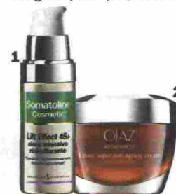
1. Lift Effect 45+ Siero Intensivo Ristrutturante di Somatoline Cosmetic ricompatta i tessuti (43 euro, in farmacia). 2. Olaz Regenerist Crema Intensiva Anti-Età lavora su tutti i segni del tempo (23,79 euro).