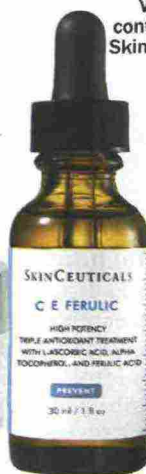
Vitamina C ed E, più acido ferulico contro lo stress ossidativo, C E Ferulic di SkinCeuticals (144,50 euro, in farmacia).