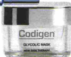
Contiene acido glicolico per un'azione esfoliante speciale Glycolic Mask di Codigen (85 euro).