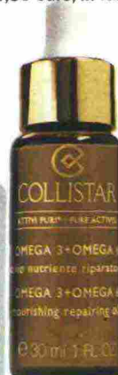
Con acidi grassi Omega 3 e 6, l'olio nutriente riparatore della linea Attivi Puri di Collistar (37 euro).