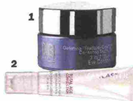
1. Gel Biefaro-Cosmetic di Dibi Face lifta la palpebra (58 euro, in istituto). 2. Rende lo sguardo più fresco: Total Age Correction Anti-Aging Eye Cream SPF 15 di Lancaster (50 euro).