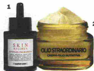
1. Stimola la produzione di collagene: Skin Regimen Juvenate-Pro Booster di Comfort Zone (86 euro). 2. Con Omega 3 e 6 Olio Straordinario Crema-Olio Nutritiva di L'Oréal Paris leviga la pelle (14,99 euro).

«In più, integratori che agiscono dall'interno come la carnosina, una sostanza antiage in grado di prolungare la vita delle cellule» dice la specialista. Un aiuto extra lo può dare il medico estetico con il trattamento Skinbooster : grazie a microiniezioni di acido ialuronico, vitamine e amminoacidi, ripristina i meccanismi di idratazione naturale.