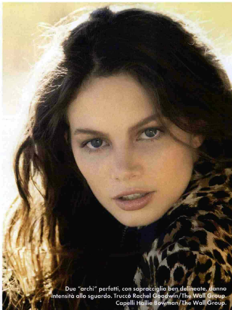
Due "archi" perfetti, con sopracciglia ben delineate, danno intensità allo sguardo. Trucco Rachel Goodwin/The Wall Group. Capelli Hollie Bowman/The Wall Group.

Sono trascorsi circa venti minuti: l'ultimo tocco è una passata sotto il solco lacrimale per depositare le microgoccioline di acido ialuronico sottopelle e stendere le grinzette delle occhiaie. Mi specchio: ho ottenuto un refreshing della cornice degli occhi e il mio sguardo sembra quello di 10 anni fa. Nessun livido, né gonfiore. Il secondo giorno compare, per 72