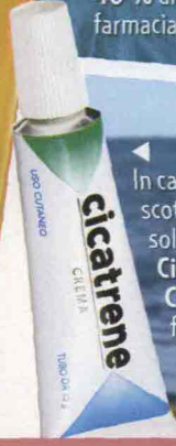
▲ In caso di scottature solari, Cicatrene Crema (in farmacia, 7,40 €).