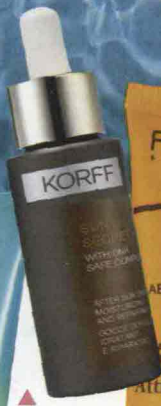
▲ Sun Secret Gocce Dopusole Idratanti e Riparatrici di Korff (25 €).