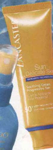
▲ Sun Delicate Skin Soothing Cream Progressive Tan SPF 50+ di Lancaster (37 €).