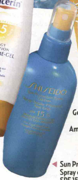
▲ Sun Protection Spray oil free SPF 15 di Shiseido (29 €).