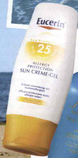
▲ Allergy Sun Protection Gel FP 25 di Eucerin (in farmacia, 22 €).

APPLICAZIONI RIPETUTE Anche se molti solari resistono all'acqua, è sempre buona norma ripetere l'applicazione dopo il bagno.