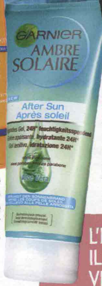
▲ Gel Idratante Lenitivo Ambre Solaire di Garnier (11,49 €).