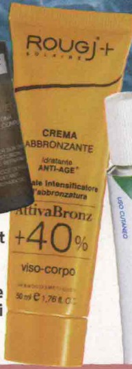
▲ Intensifica la tintarella, Crema Attiva Bronz + 40% di Rougj (in farmacia, 19,90 €).