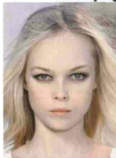
FOCUS SULLO SGUARDO

Pelle trasparente, labbra chiare e naturali: gli occhi sono in risalto con eyeliner e mascara in total black.