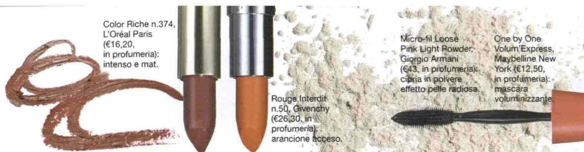
Color Riche n.374, L'Oréal Paris (€16,20, in profumeria): intenso e mat.