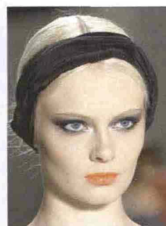
A TINTE FORTI

Se la pelle chiara è appena dorata, il trucco è minimal: gloss sulle labbra e, per le ciglia, un velo di mascara.