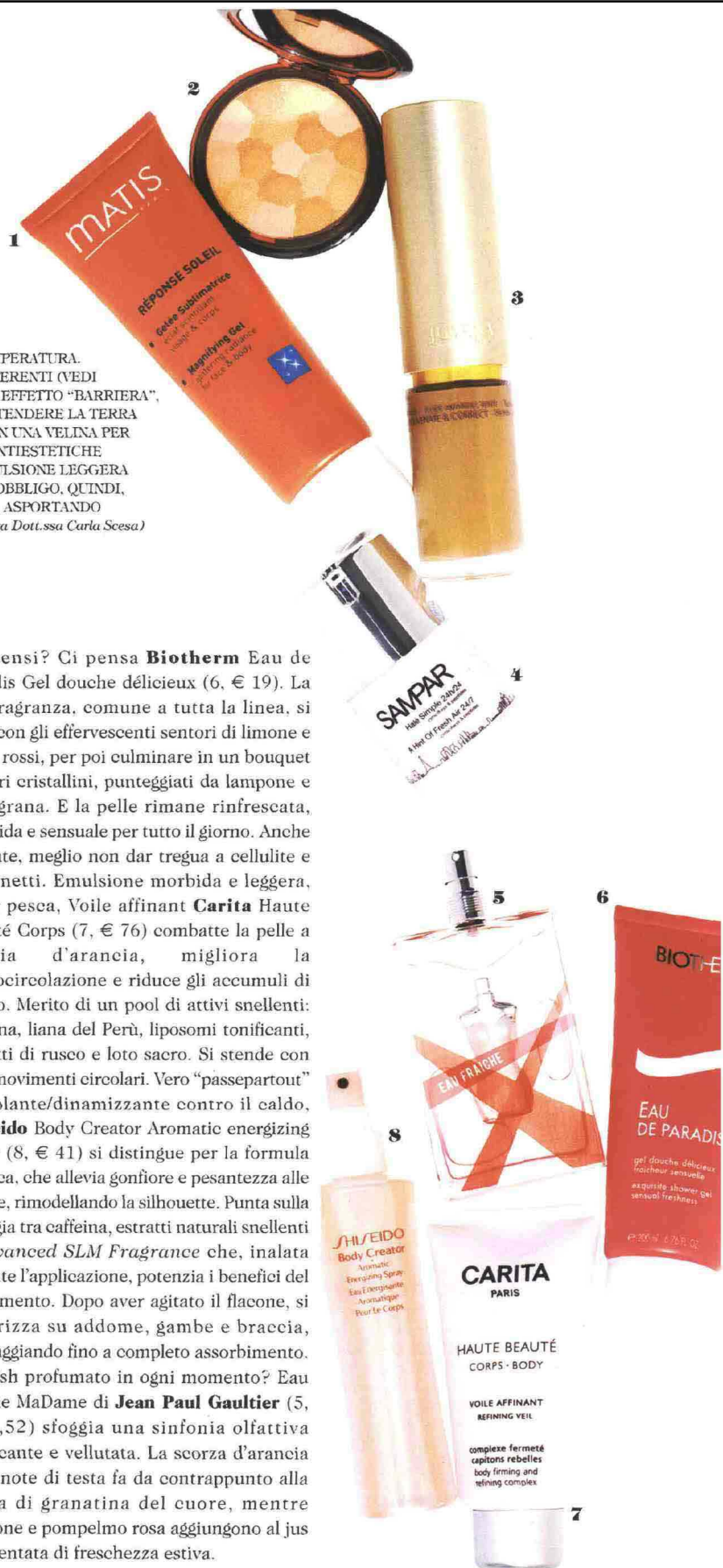
Foto MONICA VINELLA, still-life LUCA DONATO STUDIO. TRUCCO E PETTINATURE EL ENA PIVETTA @GREENAPPLE.COM