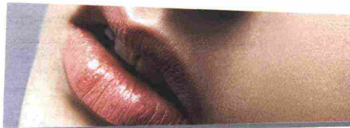
Tinta piena. Dall'alto, N°1, Dolce & Gabbana Beauty (35 €). Rouge Pur Couture Collector, YSL (34,20 €). Silky Satin Lip Colour, Christian Louboutin (80 € circa). KissKiss Baume Couleur Repulpant, Guerlain (35,90 €).

La struttura epidermica è molto simile: delicata, sottile e ad alta concentrazione di muscoli espressivi