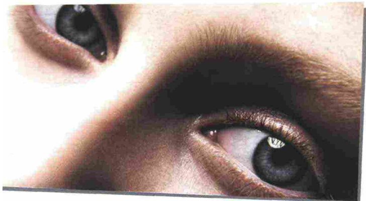
Ciglia XL. Dall'alto: Hypnôse Volume-à-porter, Lancôme (34,50 €). Full Lash Volume Mascara, Shiseido (29 €). Little Black Primer, Estée Lauder (23 €). Lash Queen Perfect Blacks, Helena Rubinstein (32 €).

sapete di che cosa stiamo parlando. Per fortuna la gioia non ha prezzo, a parte quello necessario all'acquisto di prodotti ad hoc, come il Botanical Eye & Lip Emulsion Complex di Sisley (127 euro), dalla texture quasi impalpabile e a base di piante e oli naturali che levigano e mantengono elastica l'epidermide. Oppure il nuovo Anti Aging Eye & Lip Perfection à Porter di La Prairie (126 euro), da infilare in borsetta e sfoderare all'occorrenza: una minitrouse con specchietto, con una crema gel illuminante e antistanchezza per gli occhi e un balsamo labbra che idrata, rigenera e rimpolpa, da applicare sia sotto sia sopra il rossetto.