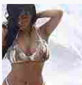
GALLERY - Il 2015 delle star comincia in bikini