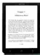
Bookeen Cybook Ocean - E-Reader + Scheda Di Memoria