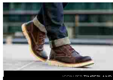
ICON PER TIMBERLAND