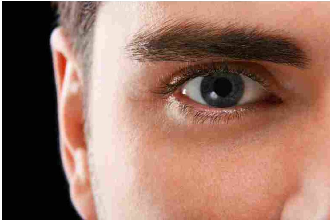
Credits: Detailed image of man with blue eye on black background