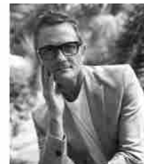
ICON PER BAIO BREGORA MILANO

Può interferire se si mangiano cibi troppo piccanti, caffè, superalcolici, che