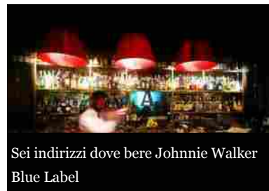
Sei indirizzi dove bere Johnnie Walker Blue Label