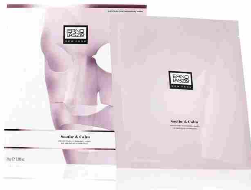
Sensitive Hydrogel Mask di Erno Laszlo