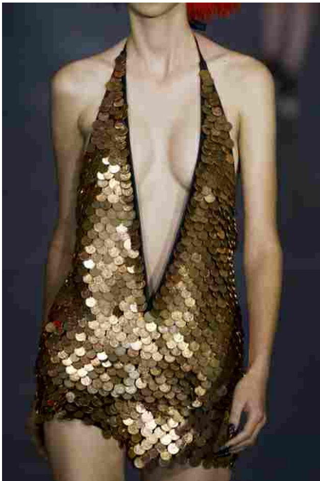
Dalla sfilata di Gareth Pugh PE 2016