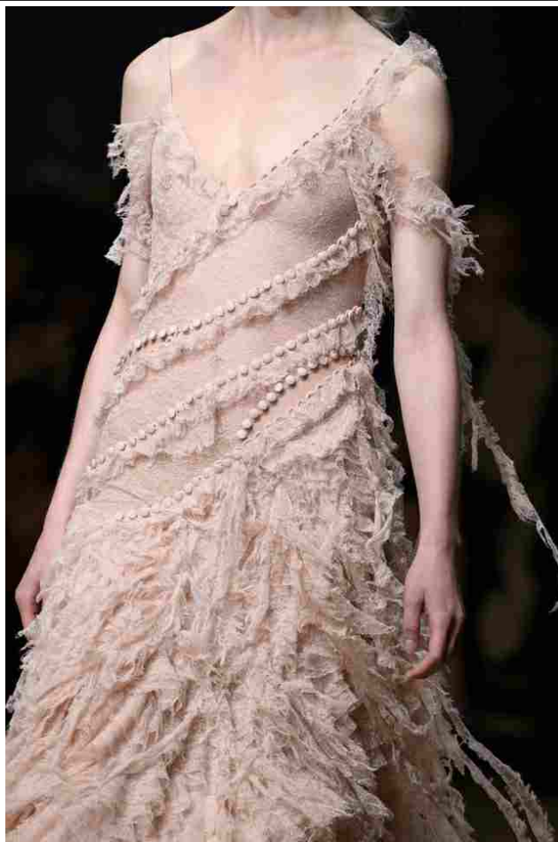
Dalla sfilata PE 2016 di Alexander McQueen