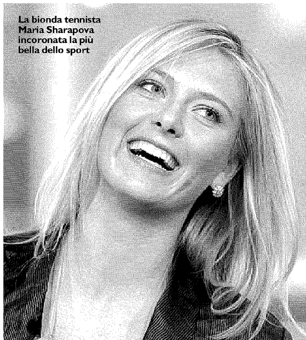
La bionda tennista Maria Sharapova incoronata la più bella dello sport