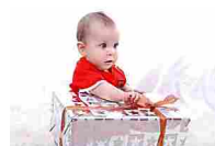
18 nomi per bambini che significano "dono"