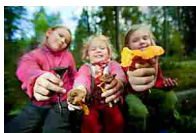
Niente funghi in gravidanza e ai bambini sotto i 12 anni