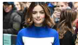
Occhiaie: le uniche borse che nessuna donna vuole