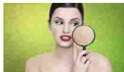
Ossigenoterapia, rigenerante trattamento viso post vacanze