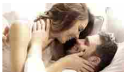
Lo sapevi che ridere fa bene al sesso e stimola l'orgasmo?