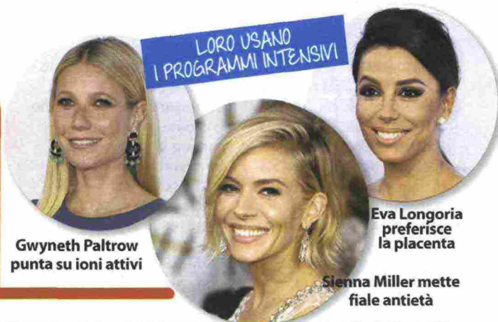
Gwyneth Paltrow punta su ioni attivi